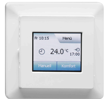
RTF-TC padlófűtés szabályozó